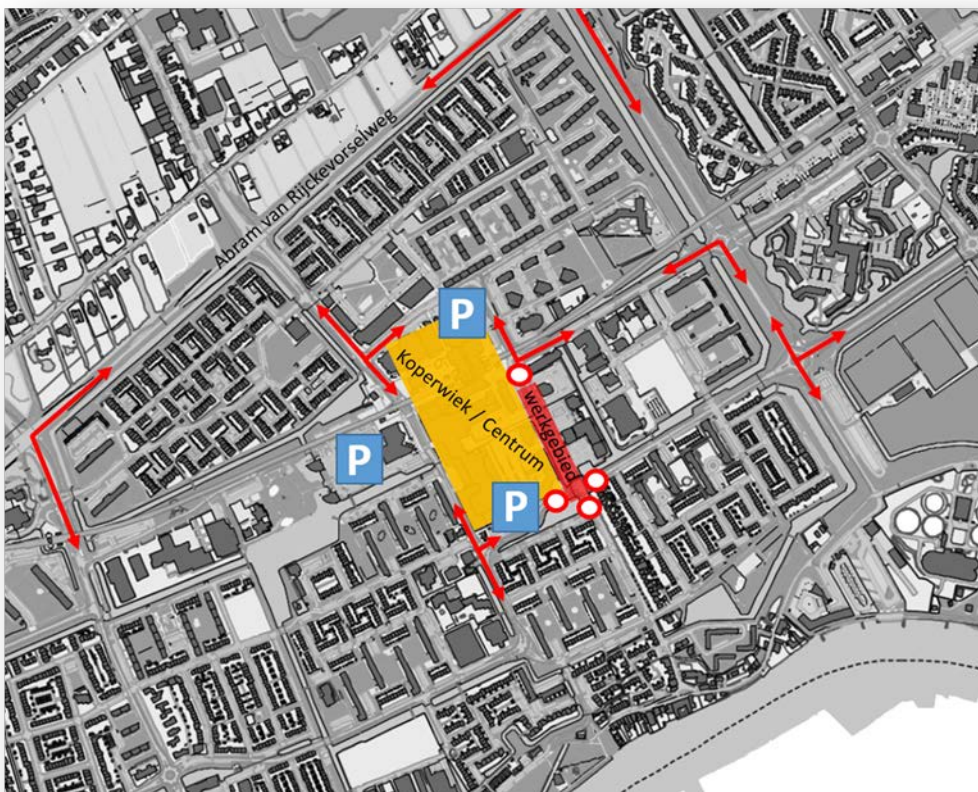
Overzichtstekening met bereikbaarheid Centrumgebied

Reist u met de bus? Kijk dan voor actuele informatie over buslijnen 37 en B4 op https://www.ret.nl/home/reizen/dienstregeling/bus-37.html