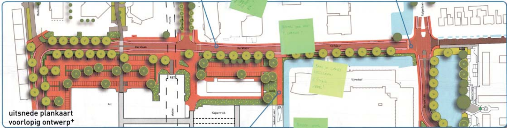
uitsnede plankaart voorlopig ontwerp+