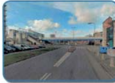
impresie kruising Duikerlaan